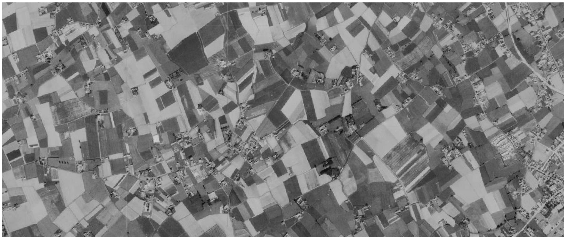
Het noorden van Hulste, 1971