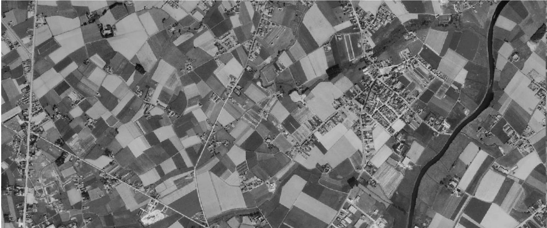
Open ruimte tussen Bavikhove en Hulste, 1971