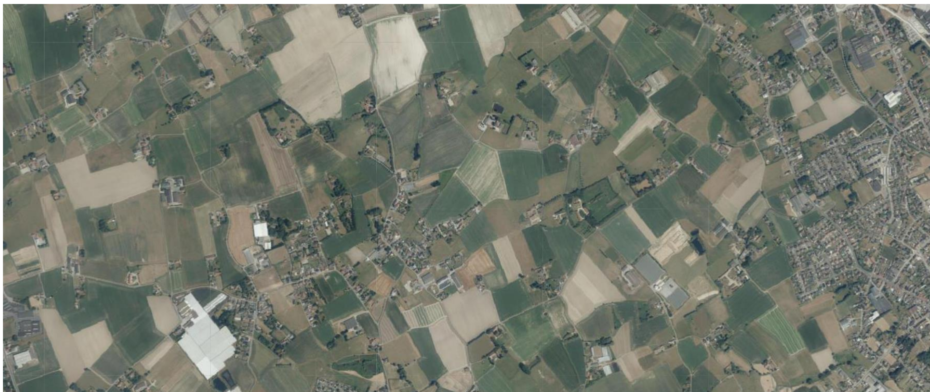
Het noorden van Hulste, 2018