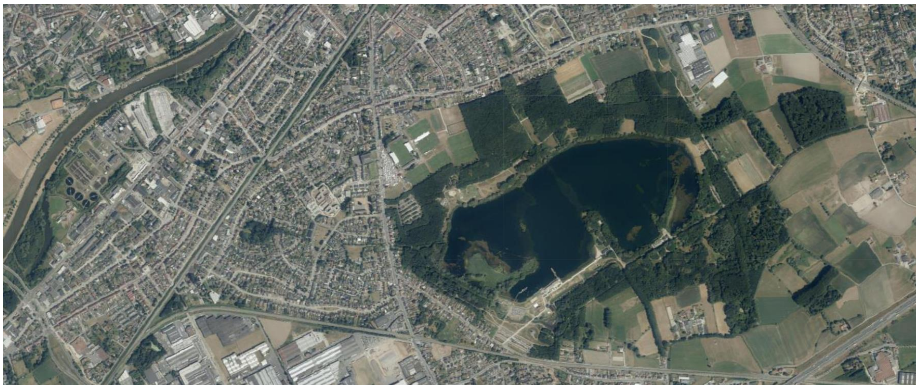
De Gavers en Collegewijk, 2018