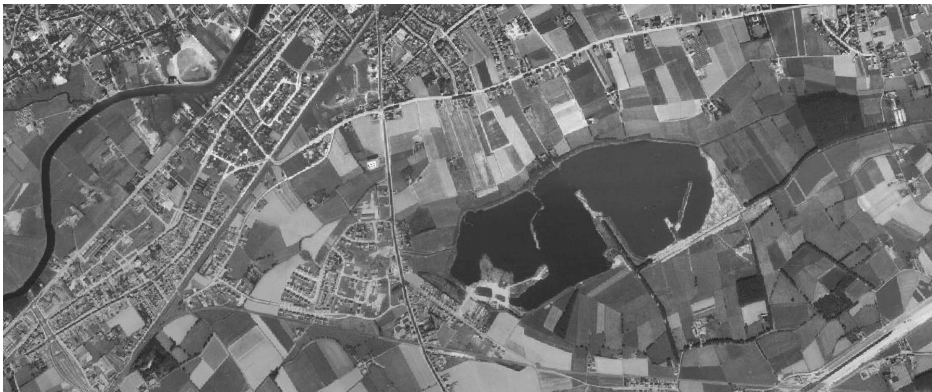
De Gavers en Collegewijk, 1971