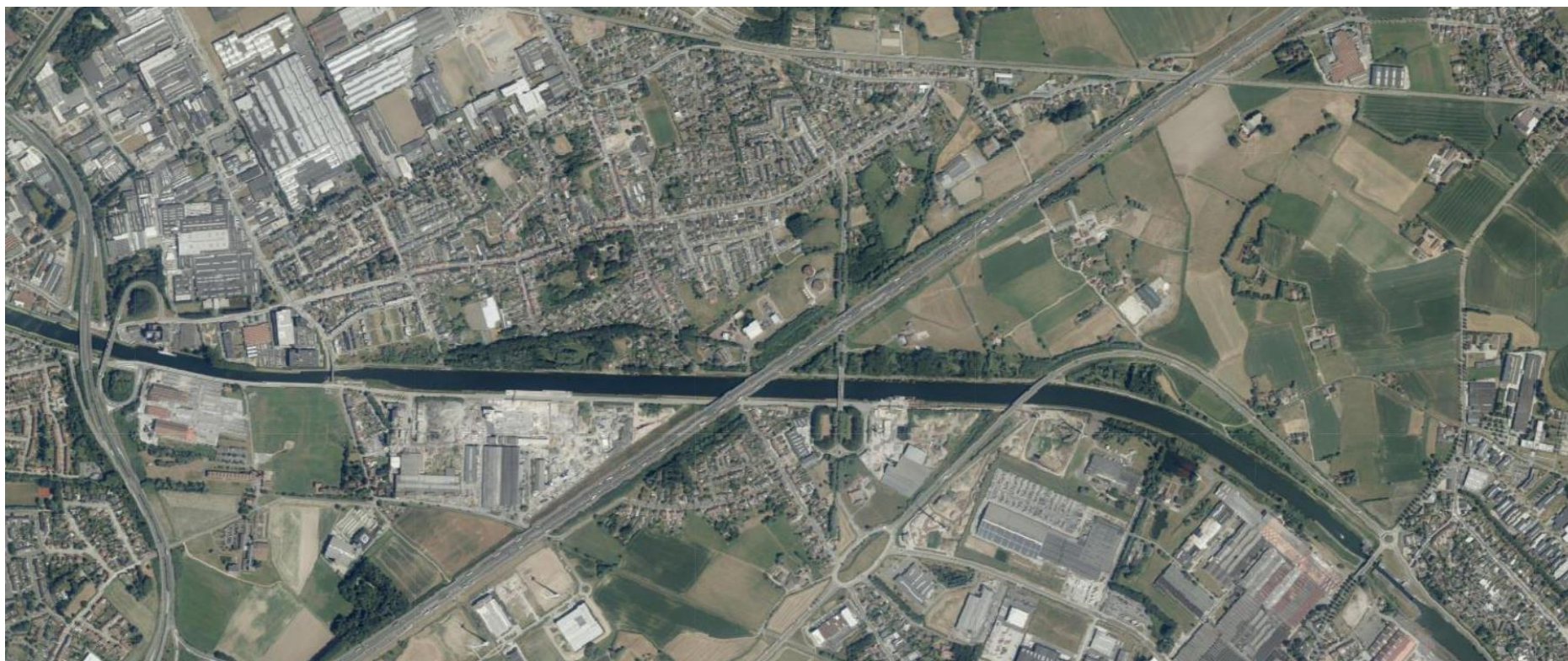
Stasegem en kanaal Bossuit-Kortrijk, 2018