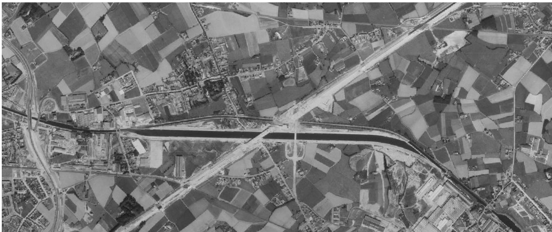
Stasegem en kanaal Bossuit-Kortrijk, 1971