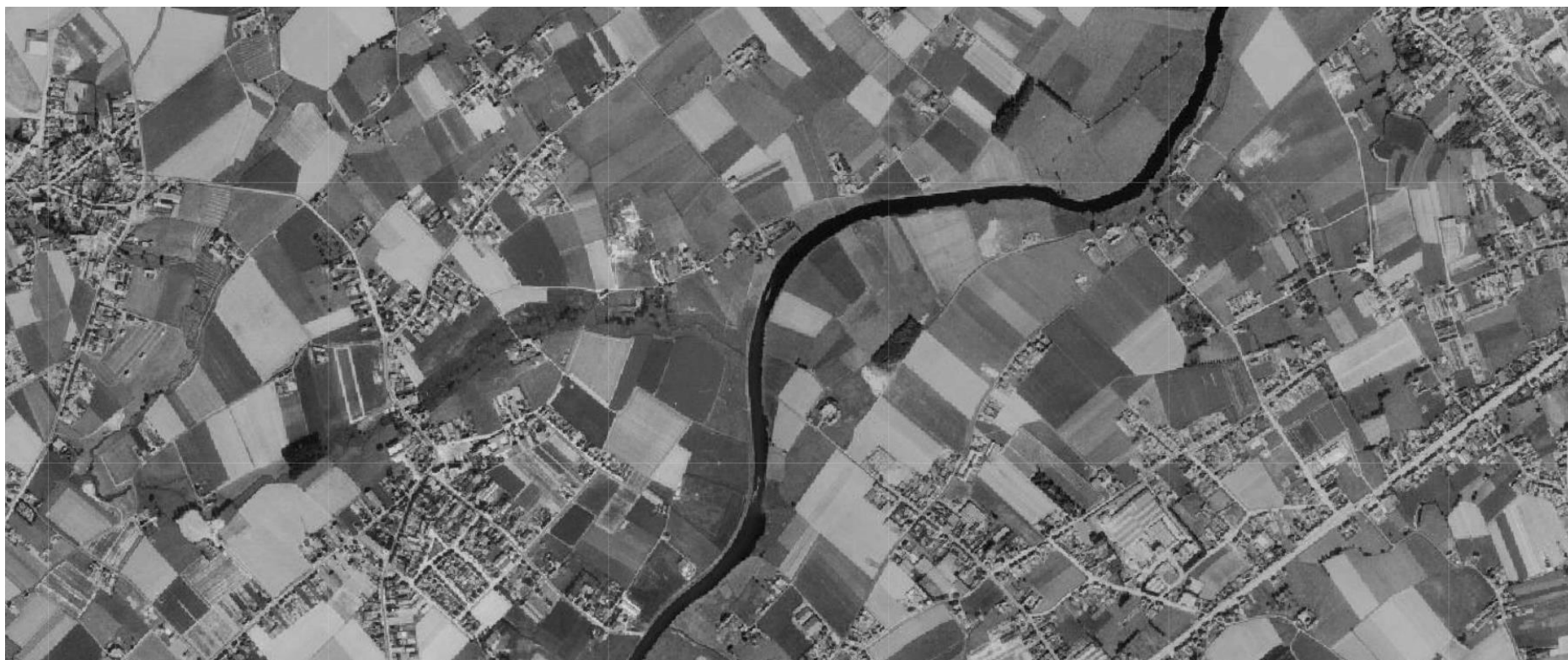
Bavikhove en Oude Leie, 1971