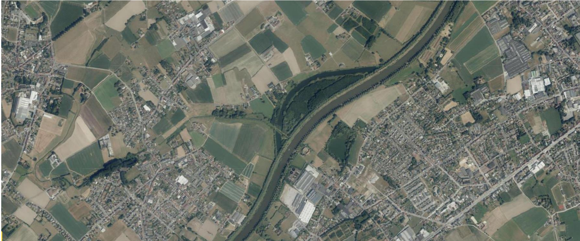
Bavikhove en Oude Leie, 2018