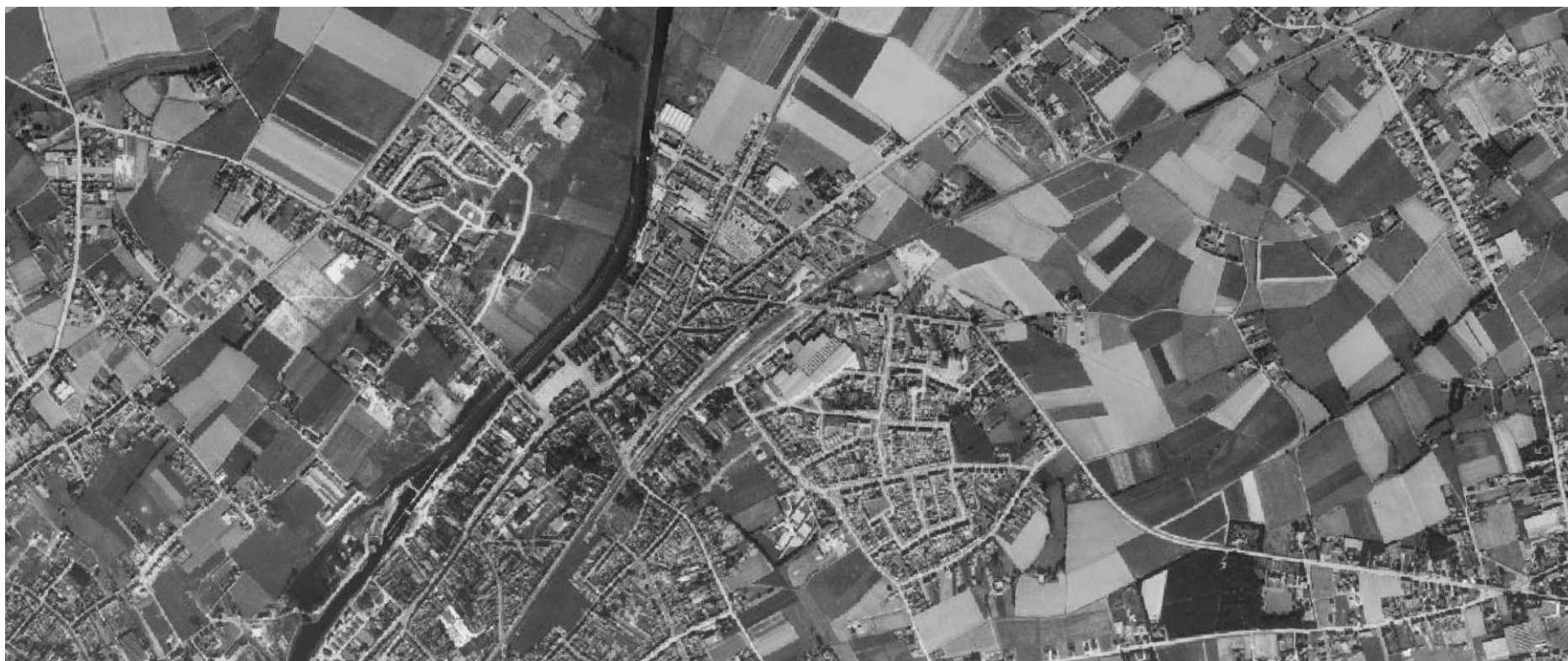
Harelbeke centrum en Spijkerland, 1971