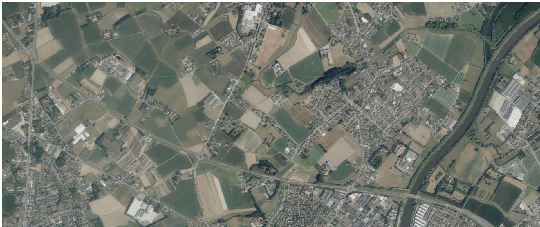
Open ruimte tussen Bavikhove en Hulste, 2018