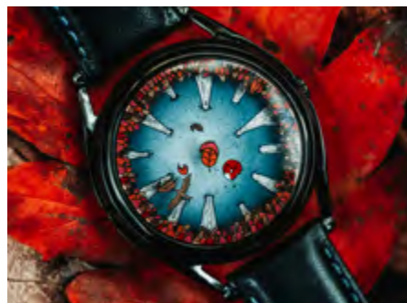
A perfectly useless morning