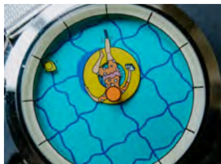
A perfectly useless afternoon